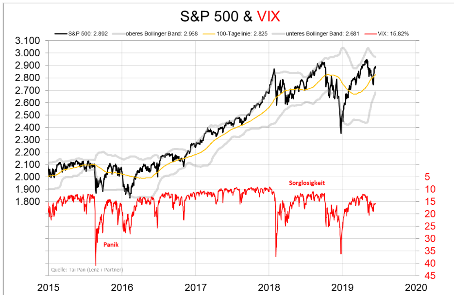
Abb. 11: Der VIX misst die implizite Volatilität auf den S&P 500 für die kommenden 30 Tage.