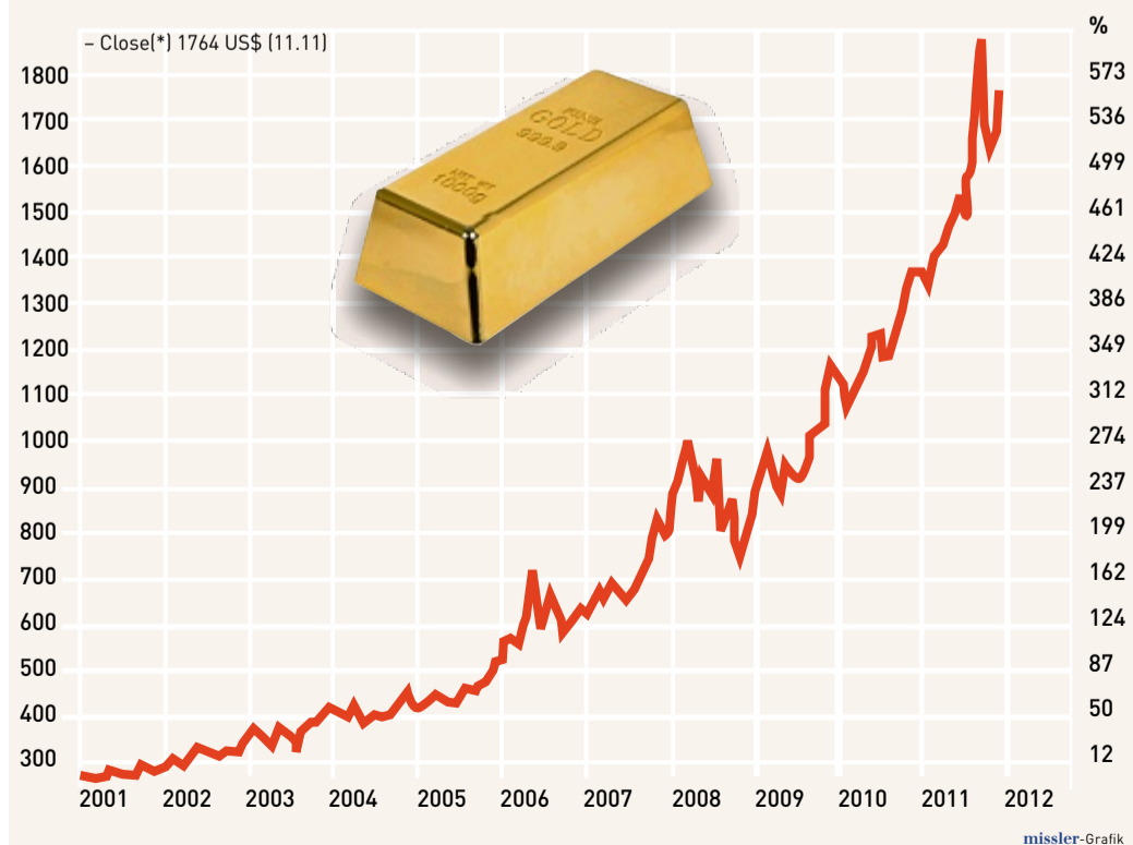
Gold – Rohstoff oder Währung? Die Meinungen gehen auseinander. Jedenfalls ist Gold kein Geheimtipp mehr. Seit 2001 ist der Goldpreis um bis zu 600 Prozent gestiegen.